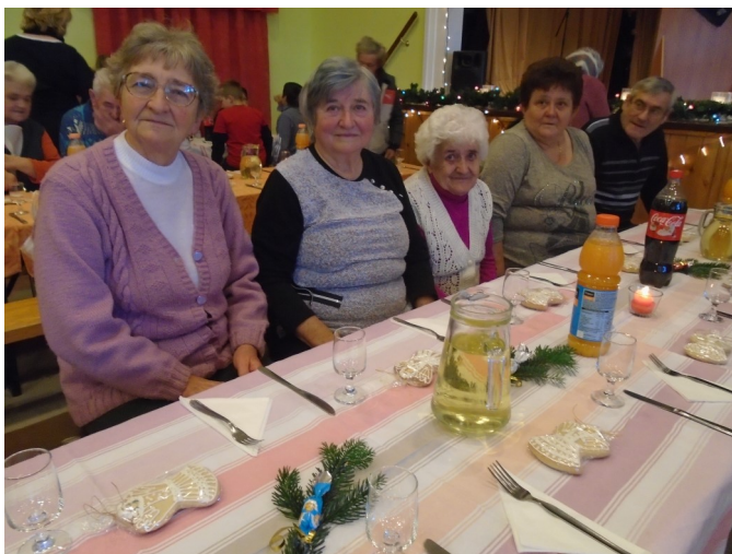
Az idősek napi vendégek