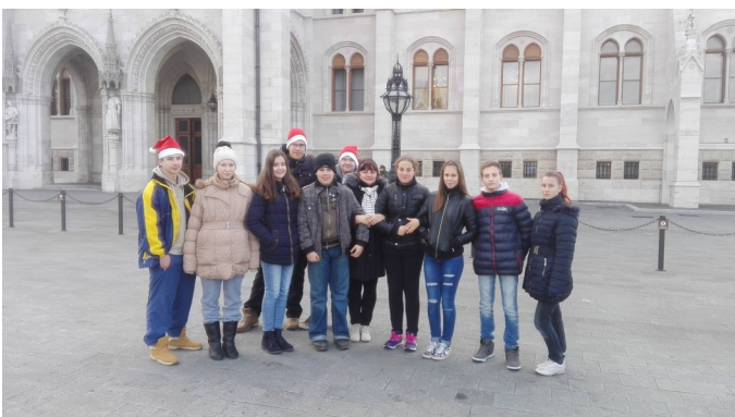
8. osztályosaink osztályfőnökükkel a Parlament előtt.

Iskolánk felső tagozatosai nagy izgalommal várták december hetedikét. Ezen a napon ugyanis Budapestre kirándultunk. Hajnali négy órakor már az iskolánál vártuk az önkormányzatok kisbuszait, melyek Zalaegerszegre szállítottak bennünket. A hosszú vonatozás után a Déli pályaudvaron várt bennünket az idegenvezetőnk. A buszos városnézés során megcsodálhattuk gyönyörű fővárosunk nevezetességeit. Vezetőnk sok érdekes és hasznos dol-