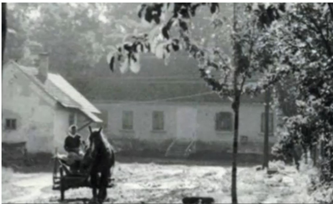
Az egykori "fövégi" Simon kocsmája, amelyen még jól látható a befalazott bejárta is.

Eleinte sokszor előfordult, hogy egymás cipőjét taposták, amin jókat derültek. Voltak, akik menet közben lemorzsolódtak, de mindig érkeztek újak, sőt nem egyszer be is teltek a rendelkezésre álló helyek. Eközben